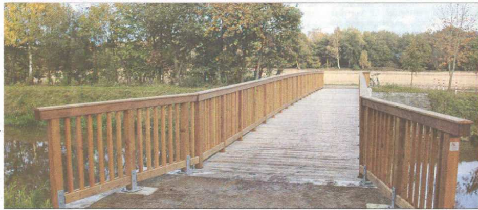
Konstruktiver Holzschutz und die Verwendung von Lärchen-Kernholz lassen dauerhafte Konstruktionen in der Gebrauchsklasse GK 3 zu.

Bei der folgenden Auswertung wurden weitere Hölzer vom Hirnende quer zur Längsrichtung bis zur Mitte der Probekörper in Scheiben gesägt. Begonnen wurde jeweils mit einer Scheibe bei 2,5 und 5,0 cm, ausgehend vom Versuchsaufbau nach Süden ausgerichteten Hirnende. Alle weiteren Scheiben wurden in einem Abstand von 5 cm ab-